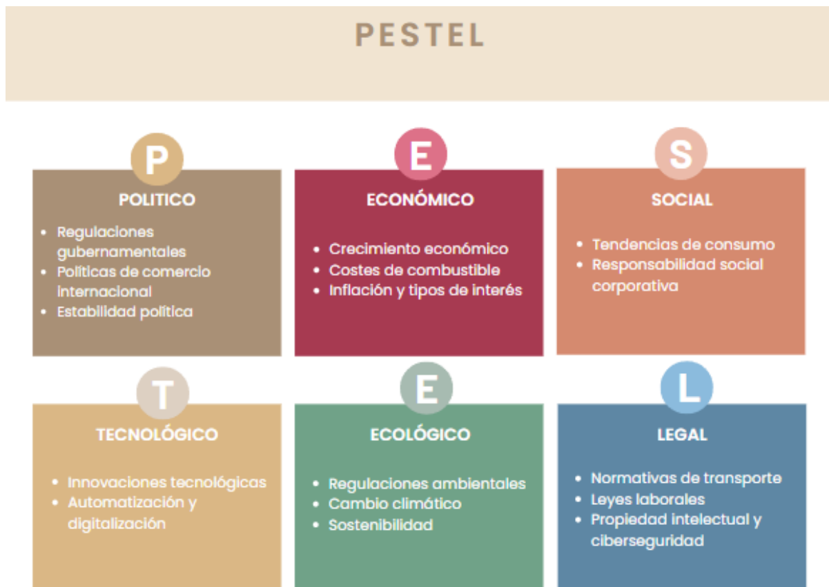
Ilustración 3.