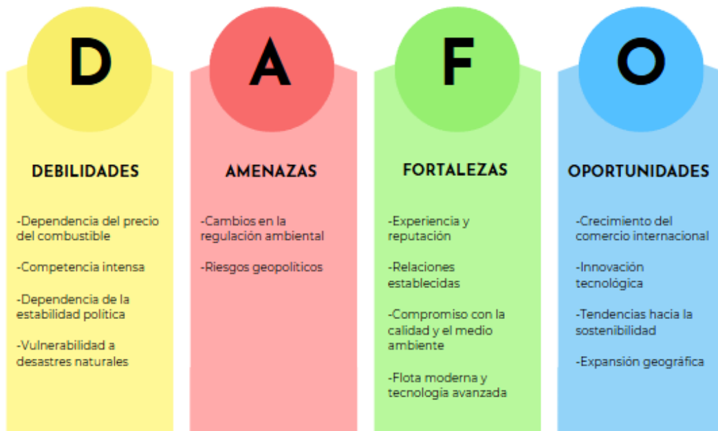
Ilustración 4. Canva