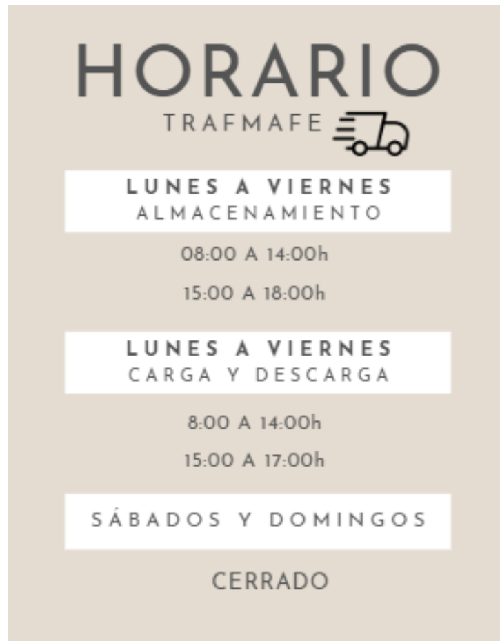
Ilustración 7. Canva