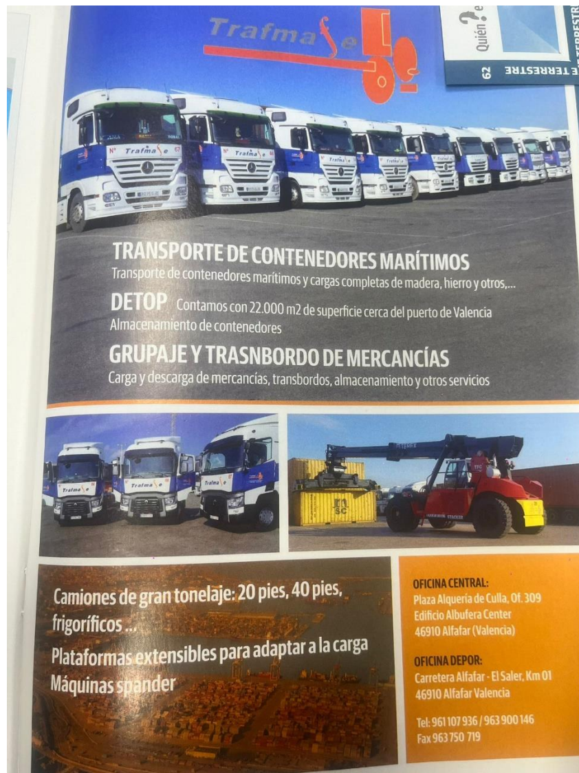
Ilustración 6. Elaboración propia

Como ya he mencionado, es un marketing más antiguo pero que es suficiente para que la empresa pueda lograr sus objetivos