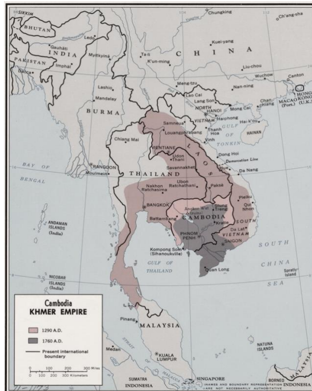
Figura 1 – Mapa del Imperio Jemer (Martínez Eukliadiadas, 2022)

Desde el año 802 D.C hasta el 1431 D.C, el pueblo Jemer contó con un poderoso Imperio y estado del sudeste asiático, que en su apogeo y época del máximo esplendor abarcaba casi todo el territorio que hoy conocemos como Camboya además de Tailandia, Laos y el sur de Vietnam. (Plubins, 2013)