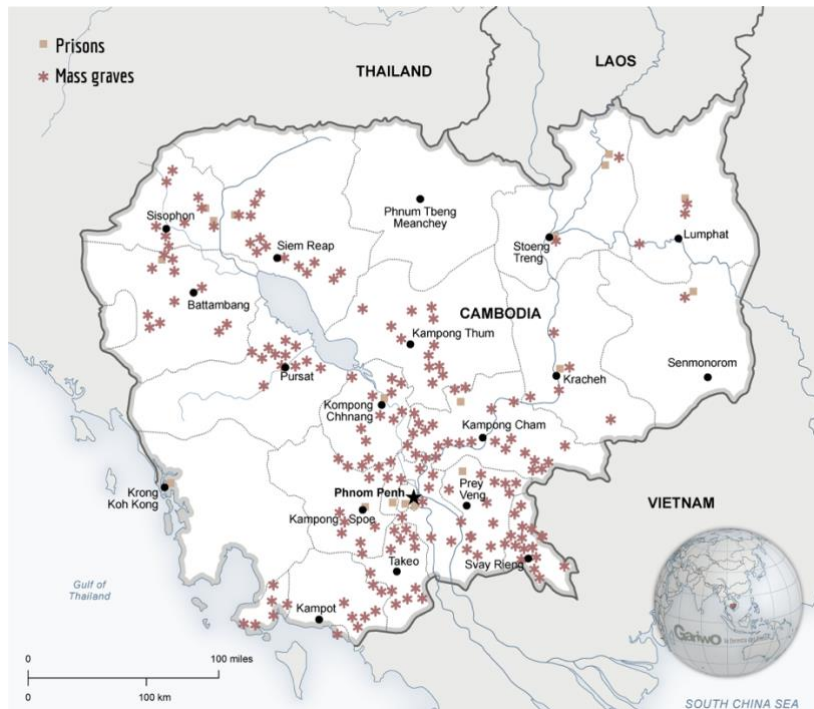
Figura 4 - Mapa de Camboya con fosas comunes y prisiones de 1975-1979 (Gariwo, 2022)