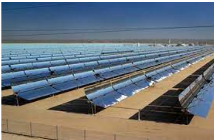
Ilustración 3. Central Termosolar ASTE

Se plantea la visita a la Central Termosolar ubicada en Cinco Casas (Alcázar de San Juan).