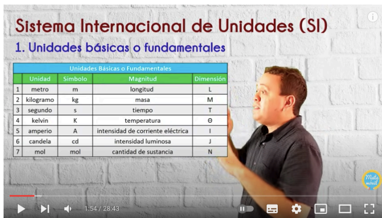
Sistema Internacional de Unidades - Introducción

https://www.youtube.com/watch?v=wGhZ5p9_sOE