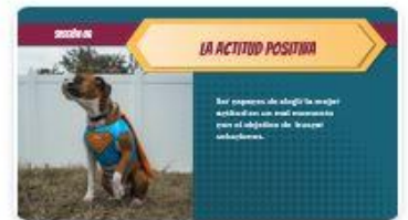
9 | Comp 02