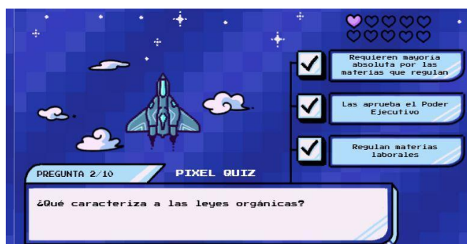
FIGURA 4. EVALUACIÓN CONTENIDOS INICIALES

Nota: Fuente: Exterior. (Orts, M.,Genially). [Captura de pantalla].