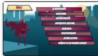
2 | Índice