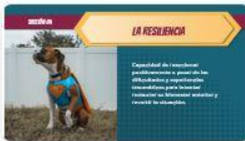
7 | Comp 02