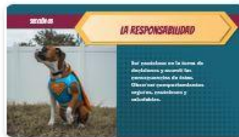
8 | Comp 02