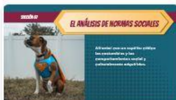
10 | Comp 02