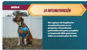
5 | Comp 02