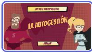
1 | Portada

https://view.genial.ly/63e50331ada031001a093891/presentation-presentacion-superheroes