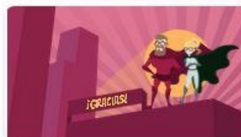
11 | FIN