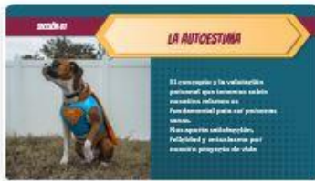
4 | Comp 02