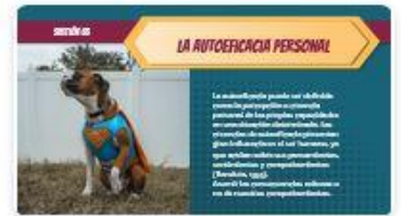
6 | Comp 02