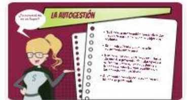
3 | Comp 01