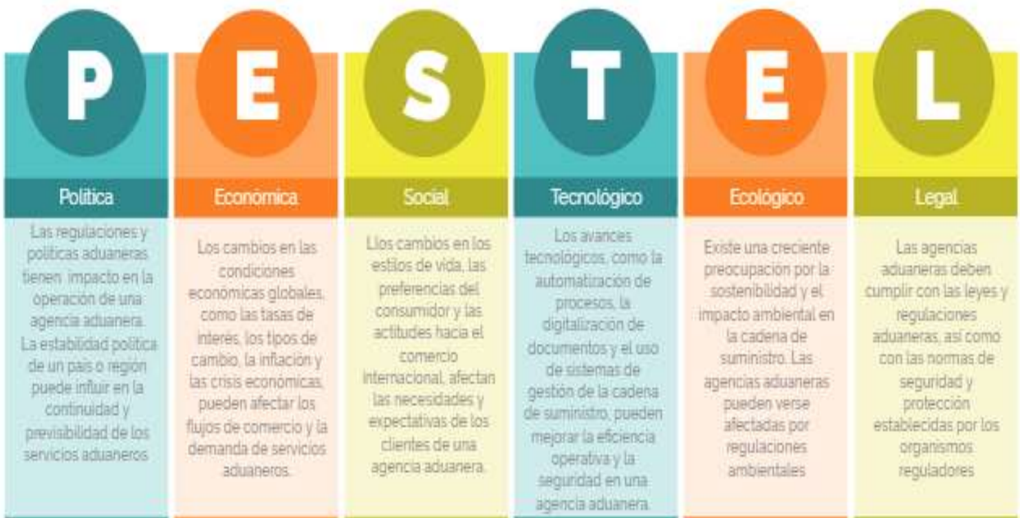
Imagen 1 P.E.S.T.E.L

Este análisis es una herramienta utilizada por las empresas para evaluar el entorno externo del sector en el que se encuentran operando.