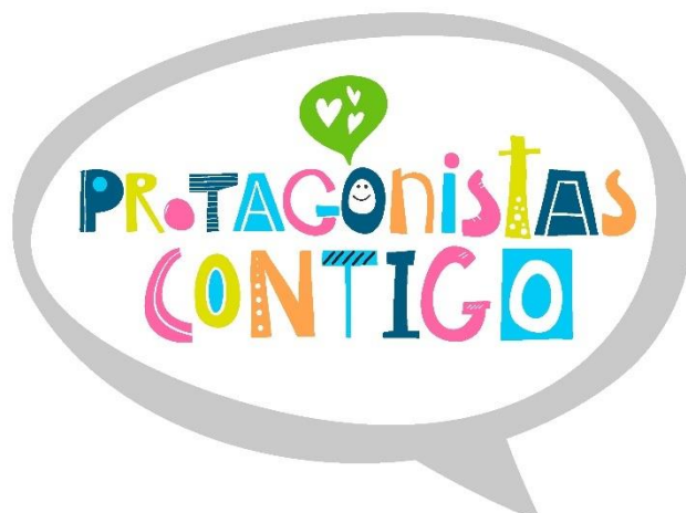
Figura 2 Objetivo del curso 2021-2022 Fundación Escuela Teresiana

Nota. Objetivo Escuela Teresiana [Fotografía]. https://eossozaragoza.escuelateresiana.com/