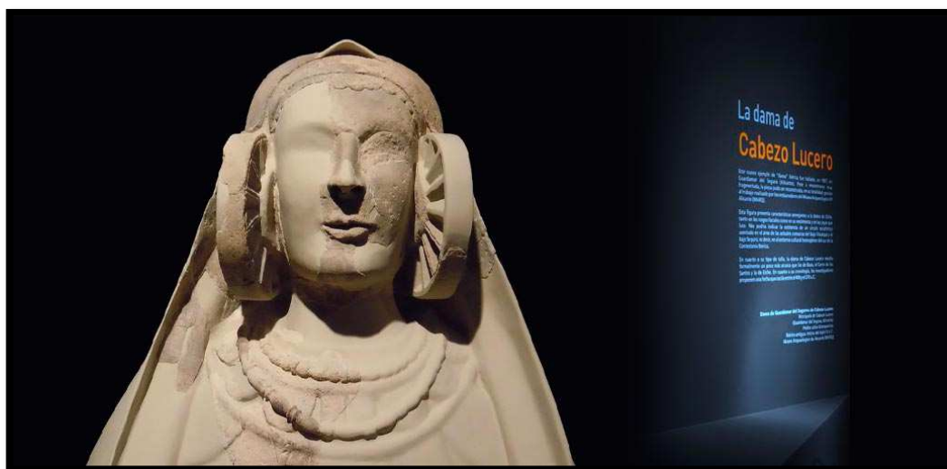
Ilustración 15: Dama de Guardamar