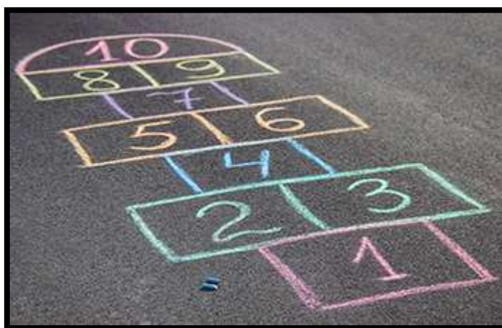
Ilustración 9: Imagen del juego de la rayuela

En el suelo se pintarán juegos tradicionales, como este: