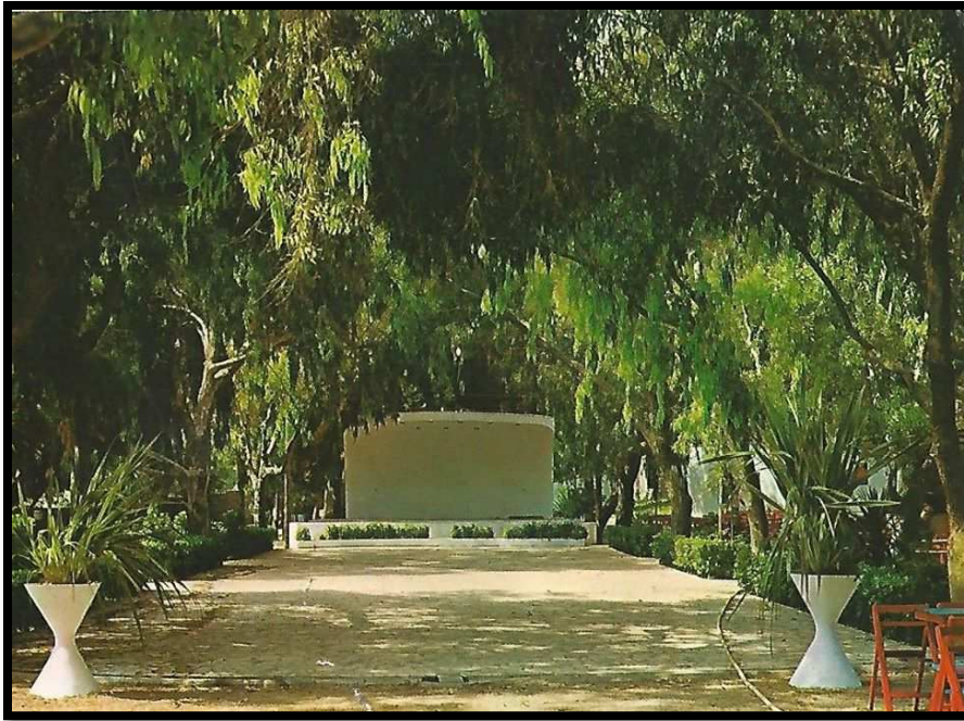
Ilustración 11: Imagen de la antigua pista (Guardamar del Segura)