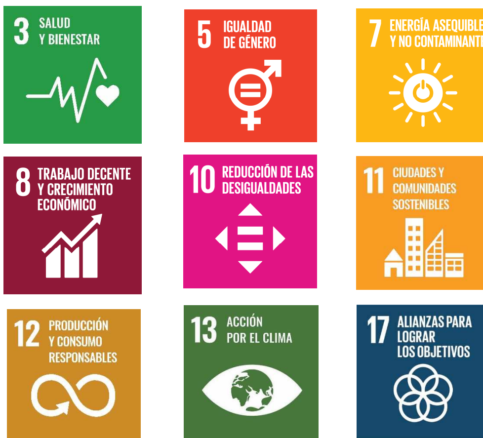
Ilustración 13: ODS que impactan en el proyecto

Por tanto, en dicho plan, se han priorizado 9 de los 17 ODS, para cada uno de ellos se ha realizado un plan de acción específico, para poder contextualizar y plantear una serie de acciones. Estos son los Objetivos de desarrollo sostenible integrados en el proyecto: