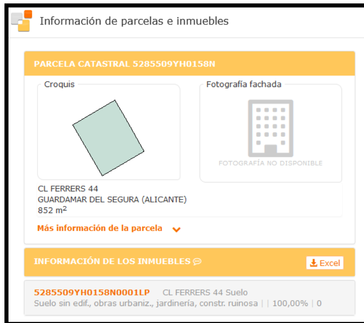
Ilustración 5: Ficha catastral parcela 2