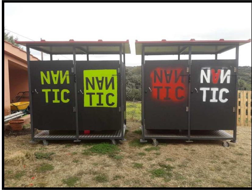
Ilustración 10: Imagen baños ecológicos de Nantic ecosaneamiento