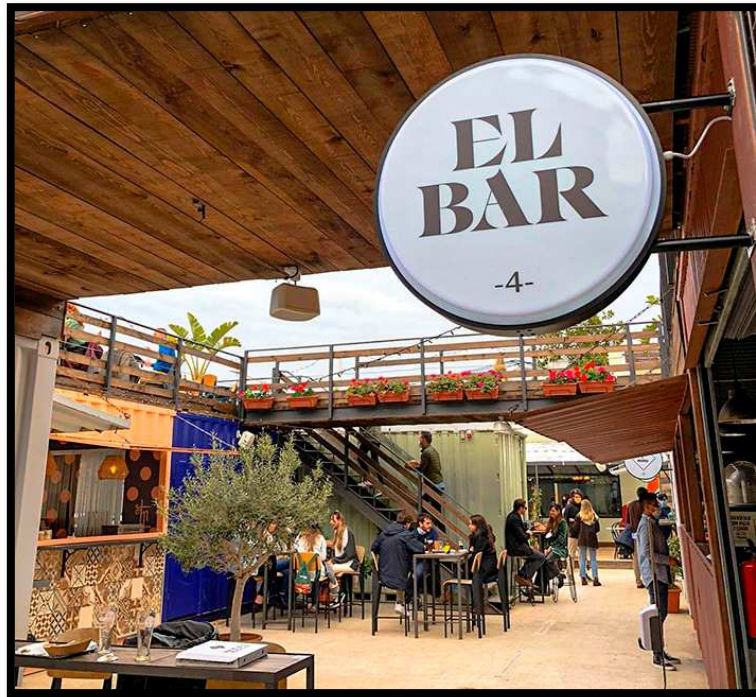
Ilustración 7: Imagen espacio Mercabanyal (Valencia)