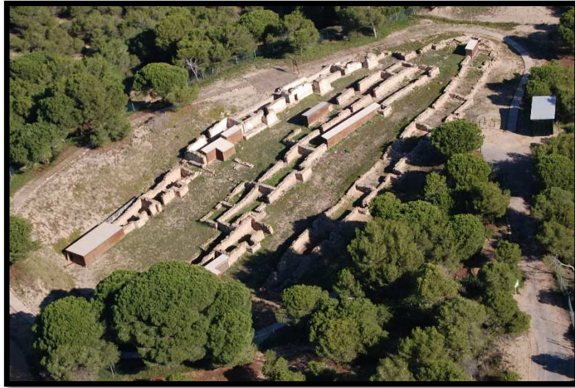
Ilustración 16: Rábita Califal