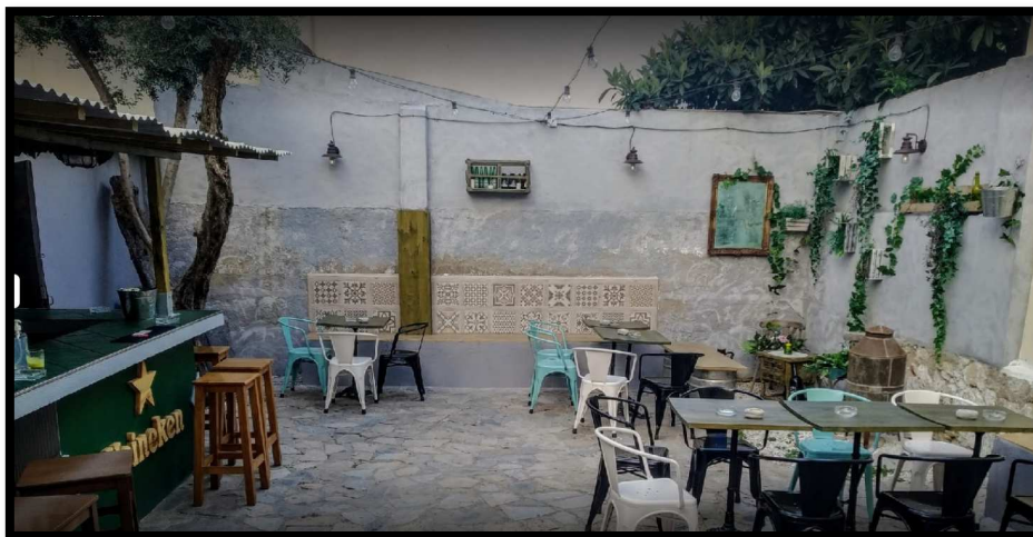
Ilustración 8: Imagen terraza Sala Euterpe (San Juan, Alicante)