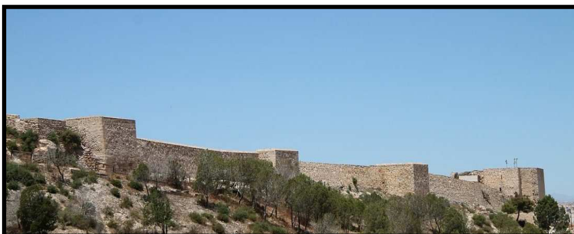
Ilustración 14: Castillo de Guardamar

posee un rico patrimonio, a continuación, se detallan una serie de imágenes del patrimonio local, como el castillo, la dama de Guardamar y la Rábita Califal.