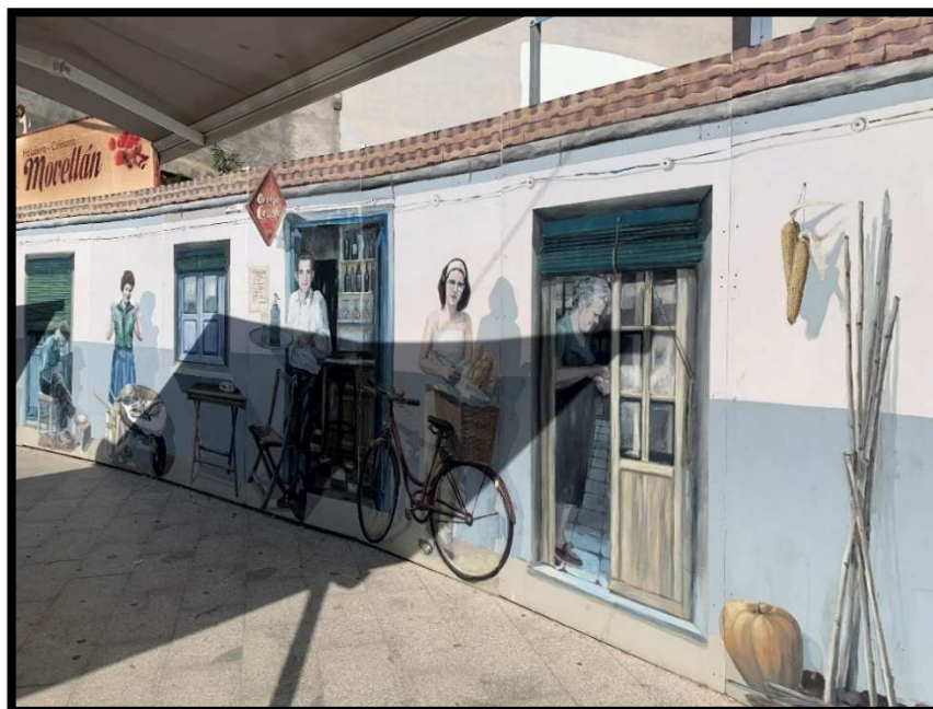
Ilustración 17: Imagen de tradiciones locales

En la siguiente fotografía, tomada en una de las calles del pueblo, se aprecian imágenes de tradiciones locales, diseñadas por artistas de la localidad, esa es la idea para la parte del espacio donde se pretenden colocar esas ilustraciones.